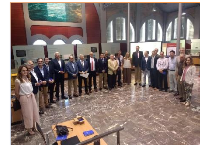
En torno a una veintena de socios de HuelvaPort han participado en la asamblea general celebrada en el mes de junio en Huelva.