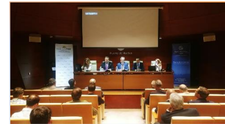
Representantes de HuelvaPort y del Puerto de Huelva .